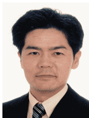
神戸労働法律研究所所長 社会保険労務士・退職年金コンサルタント